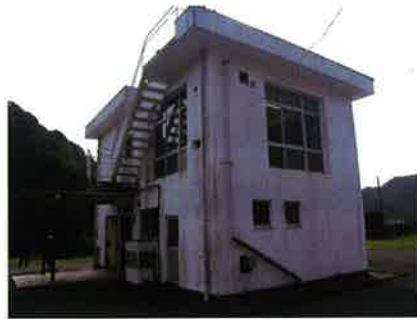
戸面原ダム管理所更新

ダム管理棟は昭和 51 年に造成されて以来約 40 年間、ダムの重要な機器を守ってくれました。