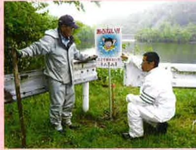
富津警察署の署員の協力をいただき看板を設置しました。