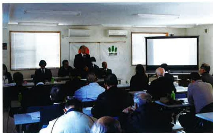
南那須土地改良事業団体協議会の皆様が複式簿記研修のため来所 (H29年2月3日)