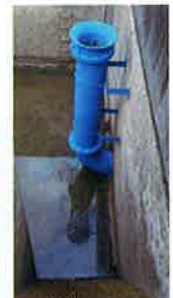
岩坂調圧水槽の放流施設の塗装