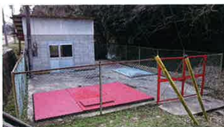
小畑南北幹線分水工の塗装