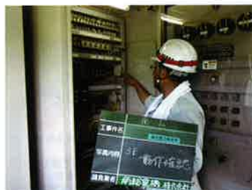
配電盤の点検状況

業務名：揚水機点検委託業務 場所：天羽地区 事業内容：揚水機点検 11 箇所 委託費：451,440 円 請負者：南総電機(株)