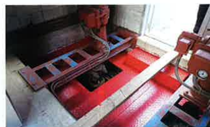
南北調整バルブの塗装