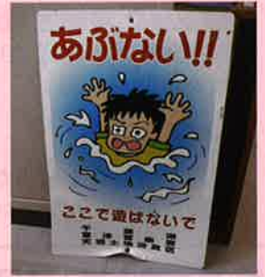
H29年4月16日、15区公民館前の駐車場に設置した看板が引き剥がされる被害を受けました。