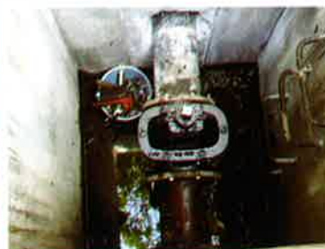
南幹線水路第1号水管橋(岩本)土砂吐弁交換