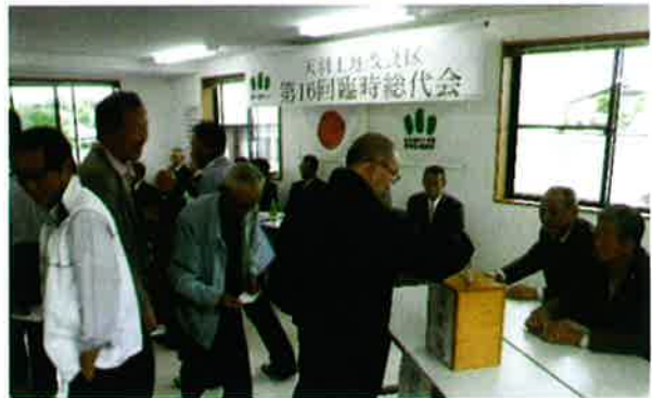
第16回臨時総代会 役員選任に伴う投票の様子