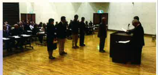
当選証書付与式の様子 (平成30年3月15日) 富津市民会館1階多目的ホールにて