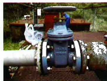
小倉揚水機場仕切弁交換