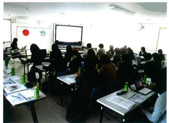
ちば水土里ネット女性の会の皆様が複式簿記研修のため当所に来所 (H29年11月22日)

参加者より、複式簿記のイメージがつかめた、今後の取り組みに役立ったとの感想を頂きました。