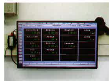
水管理用モニター設置(事務所内)