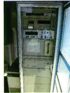
地震時自動計測装置