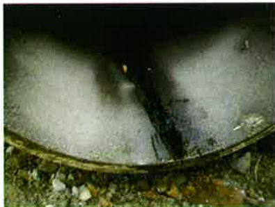
石綿管口径1000mmの亀裂状況