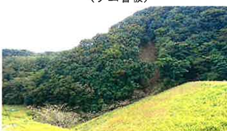
(ダム堤体隣接の山林土砂崩落)