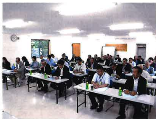
香取郡市土地改良協会の皆様が複式簿記研修のため当所に来所 (R1.7.16)

当日は、香取郡市土地改良協会の会員の皆様並びに千葉県香取農業事務所長外関係機関から総勢34名の方々が参加され、活発な意見、質問が行われ複式簿記の導入に向けて、大変参考になったとのこと感想を頂きました。