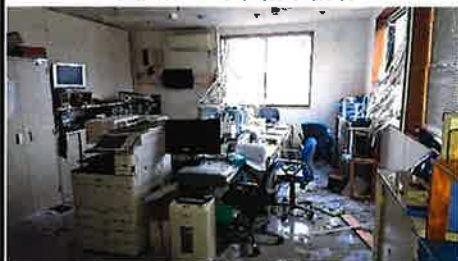
(事務所 2F 事務室)