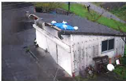
(ダム倉庫屋根・シャッター)