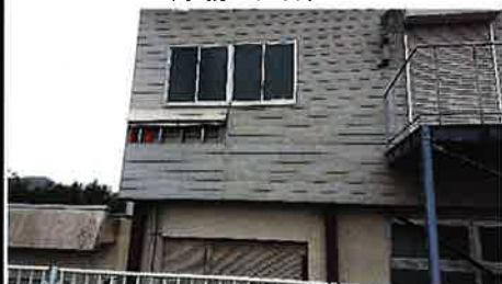
(はなわ揚水機場外壁・シャッター)