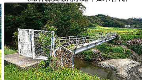
(竹岡線用水路相川水管橋)