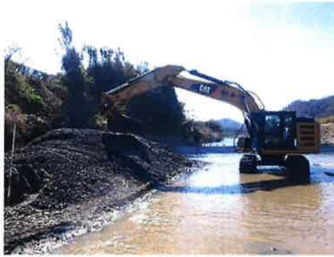
堆積土砂掘削状況 (R2年2月)