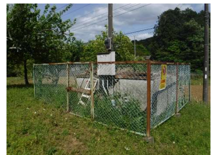
小畑揚水機場（豊岡地先）