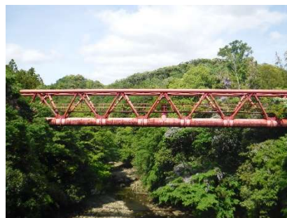
大幹線用水路第1号水管橋（豊岡地先）