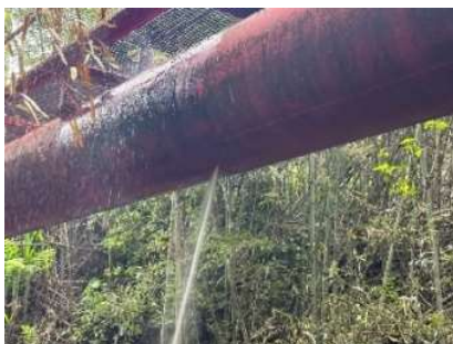
北幹線用水路第3号水管橋 東大和田地先 （R5年4月12日発生）