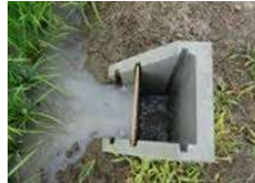
排水路の補修状況（竹岡西部環境保全会）