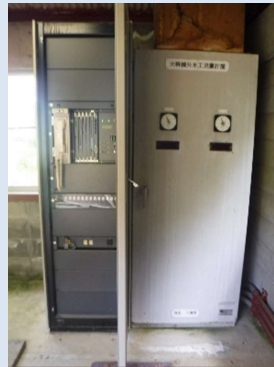
南北幹線分水工 (TM/TC装置更新)