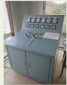
ダム管理棟遠方操作盤 (斜樋ゲート操作)