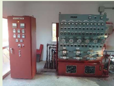
斜樋ゲート機側操作盤 油圧ユニット